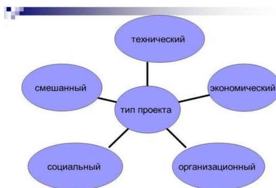
Рисунок 1 – Типы проектов в предпринимательской деятельности

Графики, схемы, диаграммы располагаются непосредственно после текста, имеющего на них ссылку (выравнивание по центру страницы). Название графиков, схем, диаграмм помещается под ними, например,