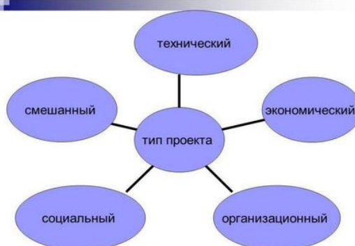
Рисунок 1 – Типы проектов

Графики, схемы, диаграммы располагаются непосредственно после текста, имеющего на них ссылку (выравнивание по центру страницы). Название графиков, схем, диаграмм помещается под ними, например,