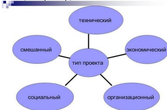
Рисунок 1 – Типы проектов

Графики, схемы, диаграммы располагаются непосредственно после текста, имеющего на них ссылку (выравнивание по центру страницы). Название графиков, схем, диаграмм помещается под ними, например,