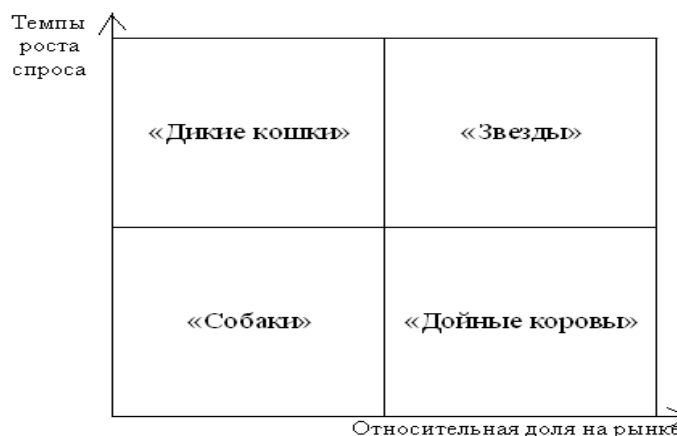
Рис.1. Матрица БКГ

Матрица БКГ позволяет организации классифицировать каждый из своих товаров по его доле на рынке относительно основных конкурентов и темпам роста отрасли. Матрица дает возможность определить, какие товары занимают ведущие позиции по сравнению с товарами - конкурентами, какая динамика их на рынке, позволяет произвести распределение финансовых ресурсов между ними. Предлагается следующая классификация товаров: «звезды», «дойные коровы», «дикие кошки», «собаки».